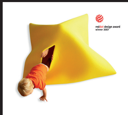
Squareplay - Igrišče za otroke in odrasle, nagrada Red Dot 2007; avtor: OLOOP

Grozdi predstavljajo socialne mreže in poslovne verige - človeški in razvojni viri, znanje, skupna promocija, finančni viri, proizvodni viri, dobavne verige znotraj enega ali med več različnimi sektorji na nekem geografskem območju. V njih se povezujejo podjetja, raziskovalne institucije, fakultete in finančne institucije, ki sodelujejo na osnovi vzajemnega zaupanja, s skupnimi cilji in nameni, kot so skupen razvoj, promocija, skupni nastopi na tujih trgih ipd.