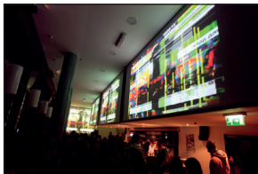
Otvoritveni teden Kina Šiška; Marko Batista: Paralelne digitalne strukture; foto: Miha Fras; vir: Kino Šiška