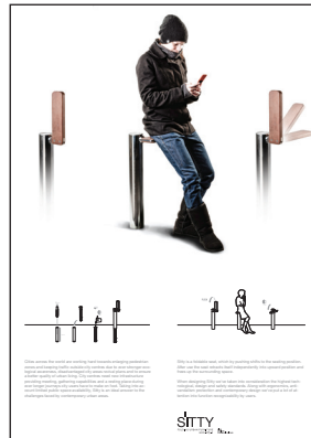
Preklonni sedež SITY, nagrada Red Dot 2010; avtorji: Miha Klinar, Martin Šošarič, Andraž Šapec