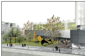
Idejni projekt Centra sodobnih umetnosti – Ragò; avtorji: Studio MX-SI, Barcelona, 2009